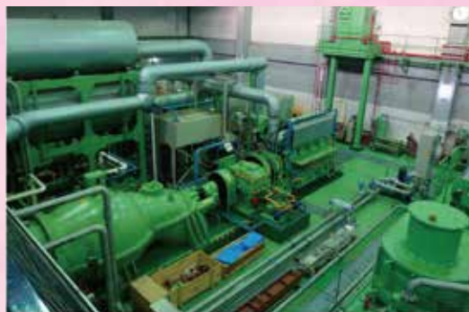
↑ 水野ポンプ場の改築された雨水ポンプ