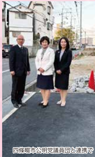
四條畷市公明党議員団と連携で

府の答弁 今後工事着手に向けた、地下埋設物の管理者等の関係機関と協議を進めていく。引き続き、市と緊密に連携し、歩行者や自転車の安全確保に向け、旧国道170号線の歩道整備に取り組んでいく。