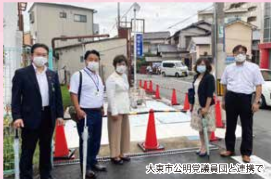
大東市公明党議員団と連携で

府の答弁 即効性のある安全対策を進めるとともに、お示しの用地買収を伴う歩道整備などについては、大東市や、地元地権者の協力状況などを踏まえ、大阪府が開催する大東市との勉強会において、緊密に連携しながら検討していく。