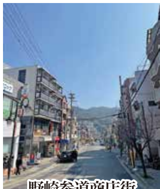
野崎参道商店街 無電柱化の歩道整備へ