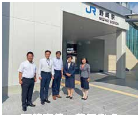
野崎駅前の整備完成