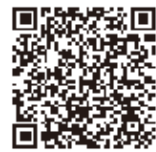
大阪防災アプリ ダウンロードはこちら