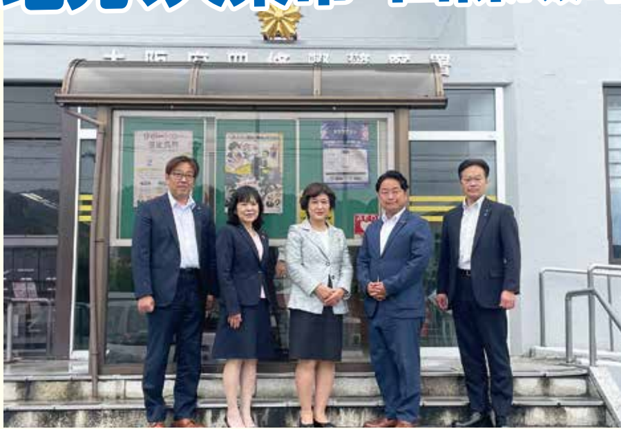
公明党大東市議団と