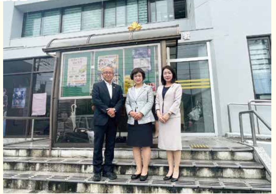
公明党四條畷市議団と

地元「四條畷警察署へ表敬訪問」公明党大東市議団、四條畷市議団と四條畷警察署へ訪問し、署長、副署長と面談。市や地域のご要望をお伝えしました。