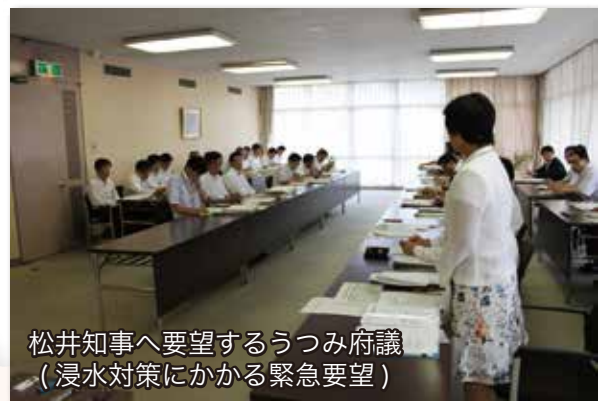
松井知事へ要望するうつみ府議 (浸水対策にかかる緊急要望)

近年の豪雨被害に対応すべく、松井知事への浸水対策にかかる緊急要望(写真)をはじめ、大東四條畷増補幹線(JR四條畷駅～寝屋川市河北中町)の早期整備を急ぐよう働きかけました。府は、約9億5,200万円の事業費を計上し、平成29年までに整備が完成します。